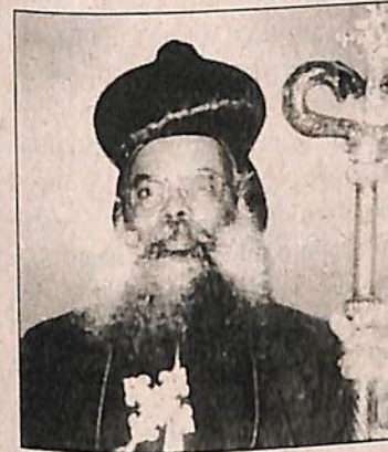
കൊല്ലം:- കൊല്ലം, തിരുവനന്തപുരം മെത്രാസനങ്ങൾ അദ്ധ്യക്ഷത വഹിച്ചുകൊണ്ട് പ. കാതോലിക്കാ ബാവ